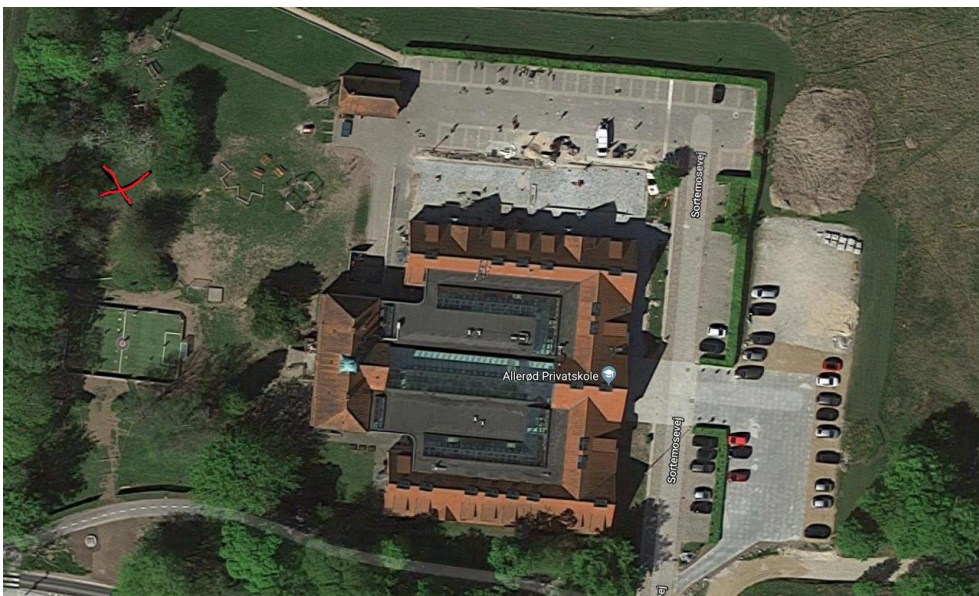
Kort 1 – viser med rødt kryds bålhyttens ønskede placering

Du har oplyst at det er ideen at bålhytten skal kunne blende så godt ind i naturen som mulig.